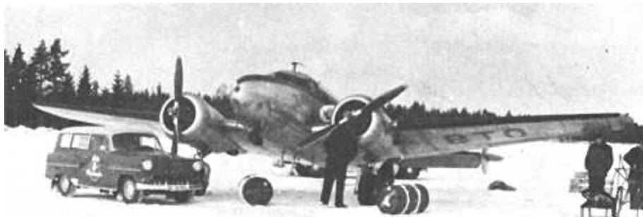
Lockheed Electra på Kronobergshed.

Övriga DC-3or såldes till Österrike samt till det svenska flygvapnet. Den som någon gång får syn på en militär DC-3a kan vara säker på att det är en före detta LIN-kärra. I april 1967 firade LIN 10-års jubileum. I maj 1967 införlivades de första två Nord 262 - franskbyggda turboprop-flygplanen - med LIN-flottan. Men därmed med måste "barndomsminnena" anses redovisade, och vad därefter kommer eller komma skall höra till "nyare" tid.